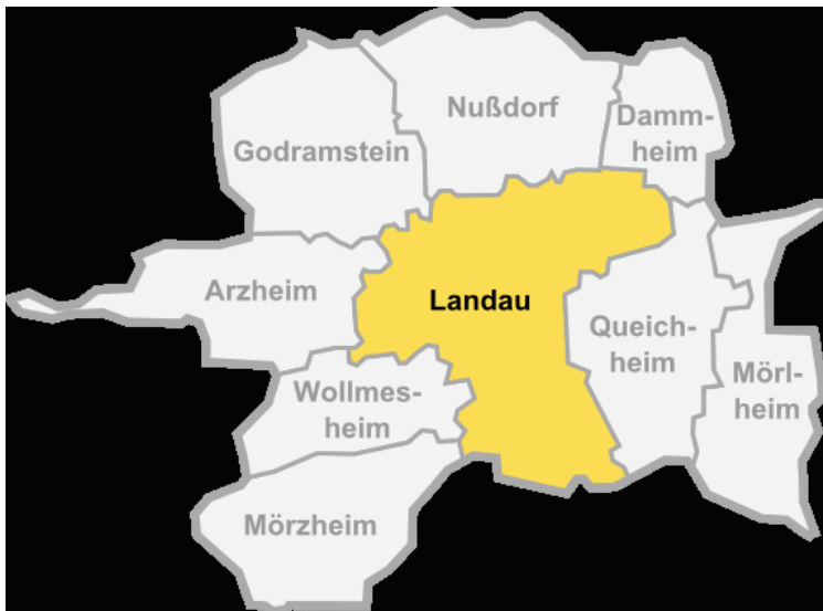
Abb. 1: Landau und eingemeindete Ortsteile (WIKIPEDIA 2014)

Das Auswertungsgebiet Landau in der Pfalz liegt in der Südpfalz und ist eine kreisfreie Stadt in Rheinland-Pfalz sowie Verwaltungssitz des Landkreises Südliche Weinstraße. Zu Landau gehören die acht eingemeindeten Ortsteile Arzheim, Dammheim, Godramstein, Mörlheim, Mörzheim, Nußdorf, Queichheim und Wollmesheim. Der Ostteil der Stadt liegt in der Oberrheinischen Tiefebene und der westliche Teil einschließlich der Kernstadt ist Teil der Weinstraße. Zur Stadt gehören Teile des Pfälzer Waldes. Östlich der Stadt verläuft heute die A 65 und nördlich der Stadt die B 10 nach Pirmasens. 1