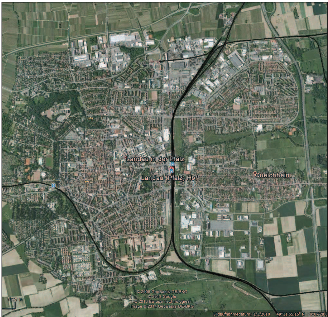
Abb. Luftbild Landau in der Pfalz